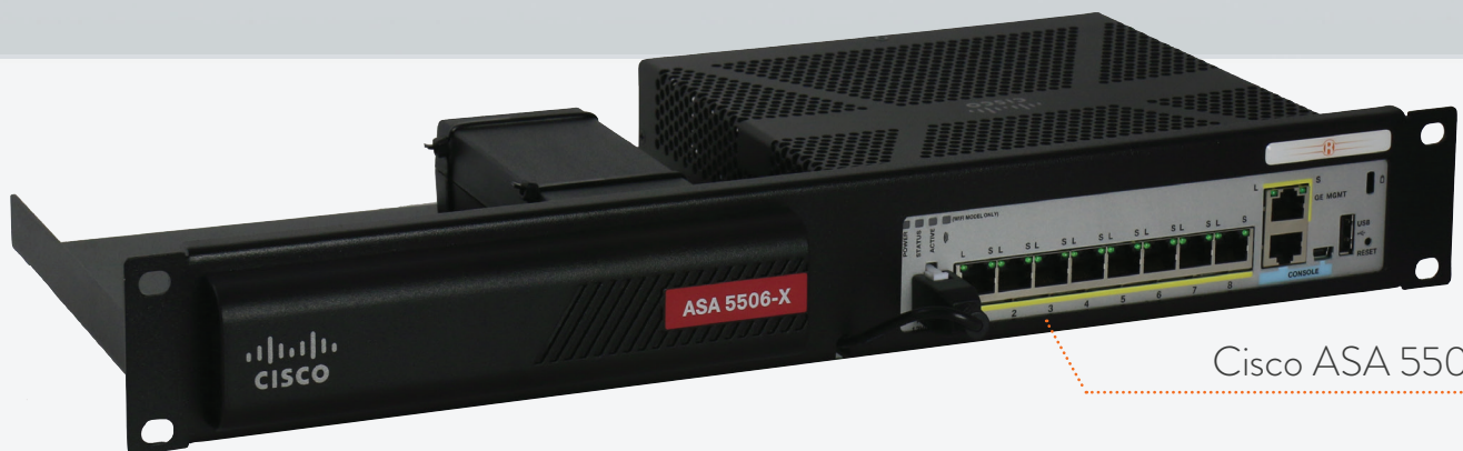
Cisco ASA 5506-X

MONTIEREN SIE IHREN CISCO MIT DEM CISRACK