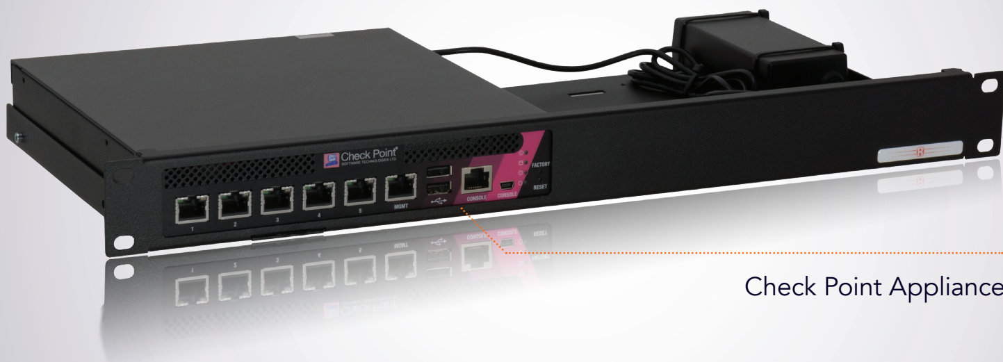
Check Point Appliance