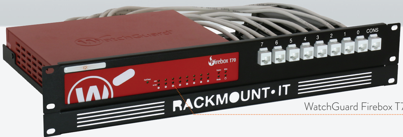
WatchGuard Firebox T70